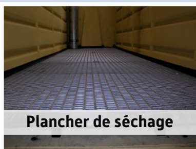
Plancher de séchage