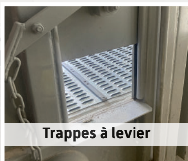
Trappes à levier